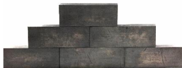
Briques de plomb Référence : 063-4100