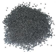
Grenaille de plomb Référence : 063-8005