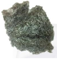
Laine de plomb Référence : 063-01C