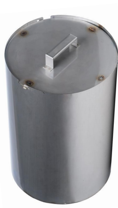
Référence : 053-1200

Pour sceller le couvercle après verrouillage, il suffit de taper légèrement sur la baïonnette qui emprisonnera ainsi l'oreille du couvercle. La préhension est télémanipulable par le fond (dans l'axe de la soudure) ou pas la poignée / The grip is telemanipulable by the bottom (in the axis of the weld) or not the handle.