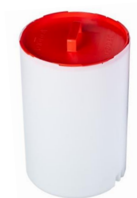
Référence : 051-1000

Sécurité et aisance de manutention de produits sensibles, toxiques ou dangereux par fermeture simple et rapide du couvercle emboîtable et transport dans les conteneurs PODEC (breveté) d'une seule main. / Safe and easy handling of sensitive, toxic or dangerous products by simple and quick closing of the nestable lid and transport in PODEC containers (patented) with one hand.