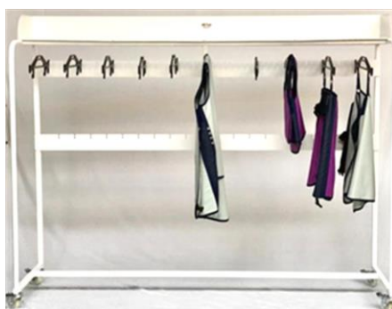
Support pour 20 tabliers ou 20 vestes et jupes livré avec 40 cintres / for 20 aprons.

Supports mobiles pour tabliers, vestes et jupes plombés, deux hauteurs de cintres possibles. Existe pour 5, 7, 8, 15 et 20 tabliers/ Mobile storage system for 5, 7, 8, 15 or 20 aprons