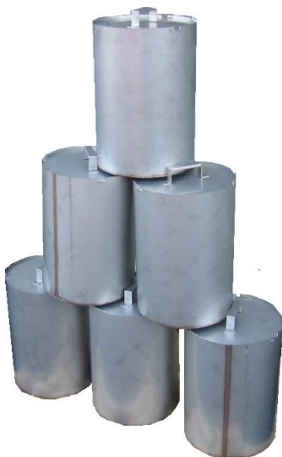
Référence : 053-1200