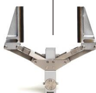
Tête de pince à serrage parallèle Tong head parallel acting