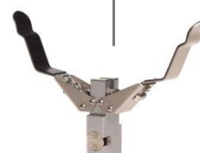
Tête de pince à serrage oblique Tong head pincer action