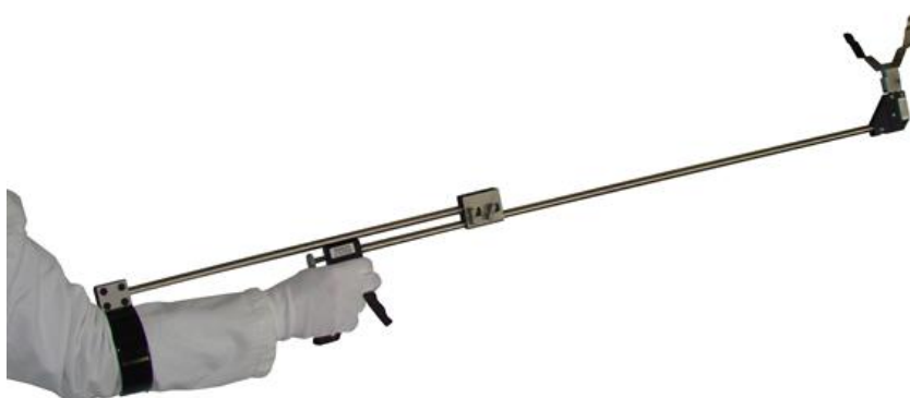
Support de pince SUMA – aide à la manutention / Arm support SUMA