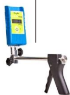
Support d'appareil de mesure Measuring device support