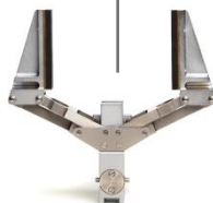
Tête de pince à serrage parallèle Tong head parallel acting