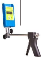
Support d'appareil de mesure Measuring device support