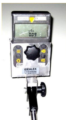
Support en INOX pour appareil de mesure sur-mesure Stainless steel support for custom-made measuring