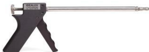
Poignée tige EMSI de longueur 30mm à 2 000mm / Handling, different length from 30mm to 2 000mm