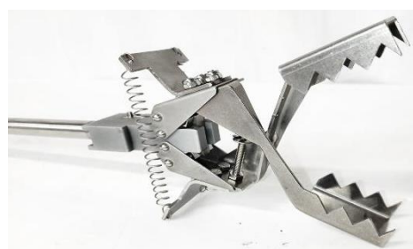
Mors spéciaux pour lingettes humides (Poids maxi. 900gr.) Special jaws for wet wipes (Max. weight 900gr.)