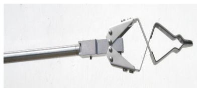
Mors spéciaux à becs inversés Special jaws with reverse jaws