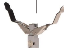
Tête de pince à serrage oblique Tong head pincer action