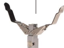
Tête de pince à serrage oblique Tong head pincer action