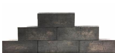
Briques de plomb Référence : 063-4100